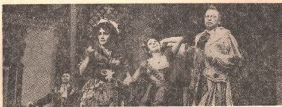
НОВАЯ ОПЕРА ТИХОНА ХРЕННИКОВА. Комическая опера «Доротея» создана по мотивам комедии английского драматурга Р. Шеридана «Дуэнья» (либретто Я. Халецкого). НА ШИМКЕ: сцена из оперы «Доротея».