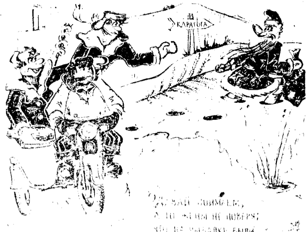
Новогодние шутки Бориса ДЕМЬЯНЕНКО.