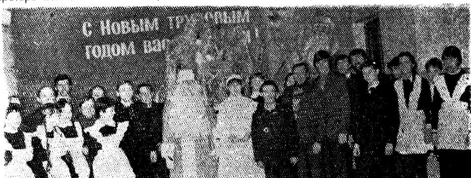
Так встречают новый трудовой год на шахте им. Ленина.