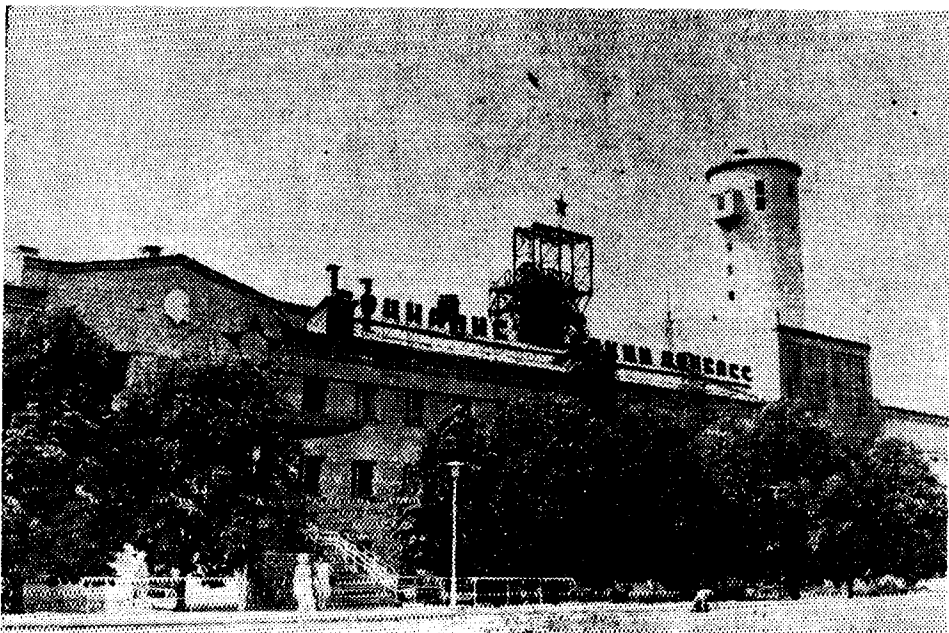
Шахта «Социалистический Донбасс».