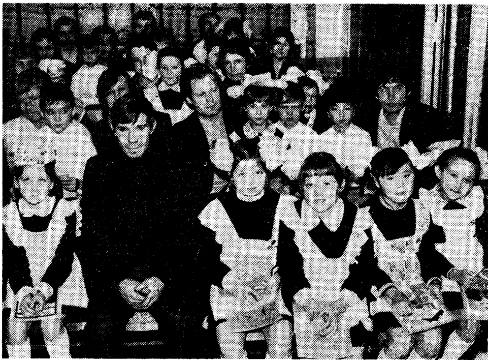
Третьеклассники СШ № 7 в гостях у шефов, горняков участка № 4, добывших 500 тысяч тонн угля.