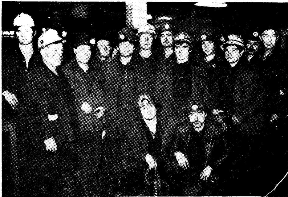
ВОТ ОНИ — ПОБЕДИТЕЛИ СОРЕВНОВАНИЯ!