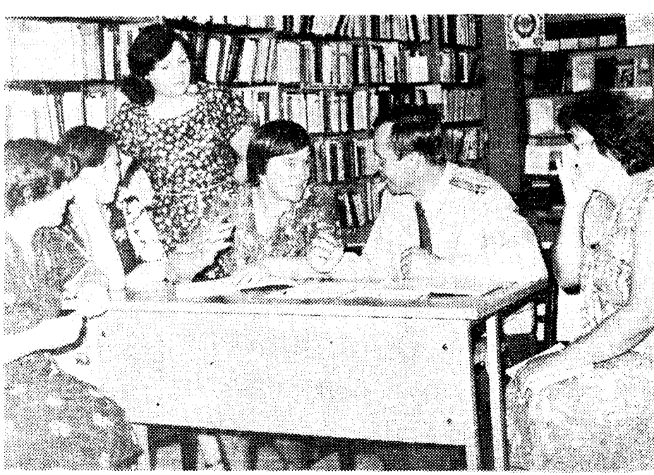
В гостях у библиотечной центральной библиотечной системы работники милиции.