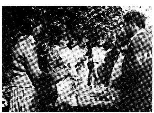
В ДЕНЬ ПРАЗДНИКА КНИГИ.

от несчастных случаев. Экономьте газ, не жгите его, когда нет в этом необходимости, не обогревайте помещения за счет газовых плит — это не только малоэффективно, но и не безопасно. ШАХТИНСКИЙ ГОР-ГАЗ. 20 октября в 18 часов во Дворце культуры горняков состоится очередное заседание женского клуба (шахта им. В. И. Ленина) «Ромашка». Приглашаются все желающие. Тема занятия: «Всей семьей — во Дворец».