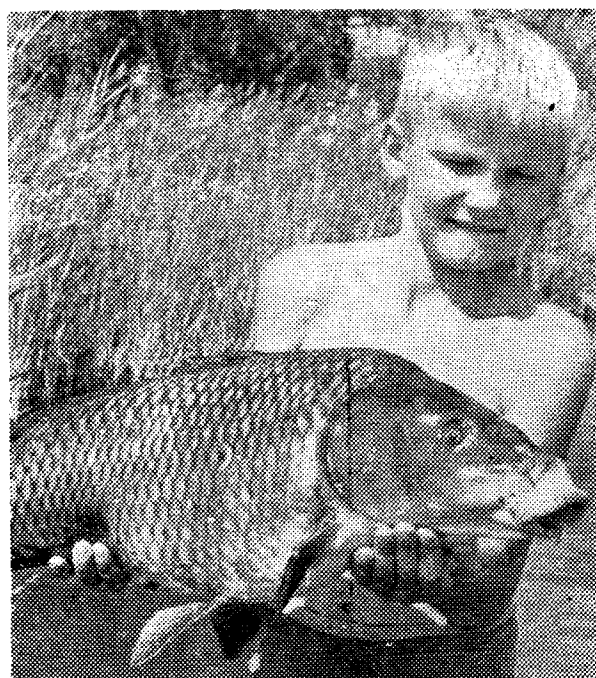
ВОТ ЭТО УЛОВ!

г. Караганда. («Карагандинская правда» от 18 сентября).