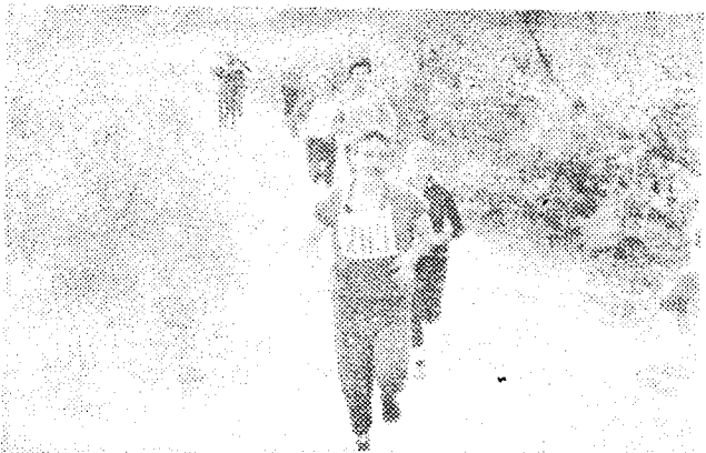
В ДЕНЬ БЕГУНА. ВСЕ ХОТЯТ БЫТЬ ПЕРВЫМИ.