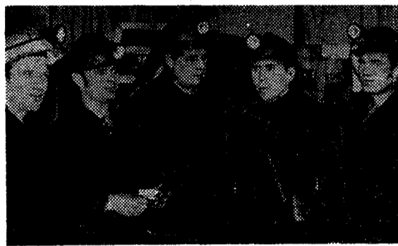
ПЕРЕД РАБОЧЕЙ СМЕНОЙ.

УПР-3 не смог пройти 152 метра, УПР-1 УПР-4 — по 40 метров минусуют. Единственный УПР-2 заканчивает месяц с «плюсом» — 27 метров.