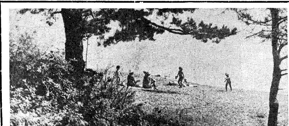
В окрестностях Каркаралинска.