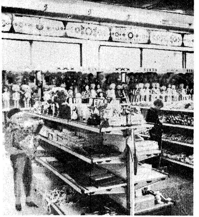
В «Детском мире».