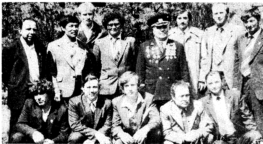
Группа наставников шахты на областном слете.