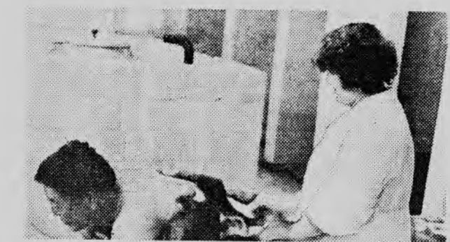
Принимают грязелечение в профилактории «Рассвет» горняки города.