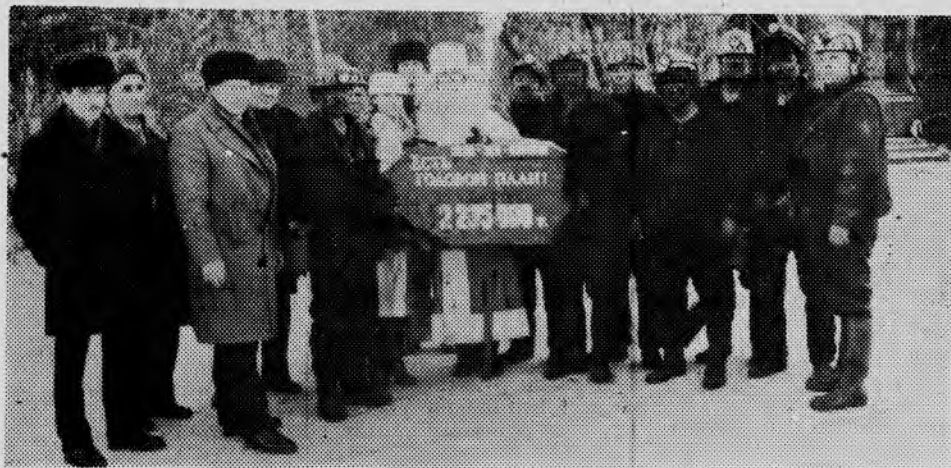
День, когда шахта выполнила годовой план.

Поэтому, вступая в новую пятилетку, мы, коммунисты, партийные руководители, должны учесть все наши недоработки и выработать пути по их ликвидации.