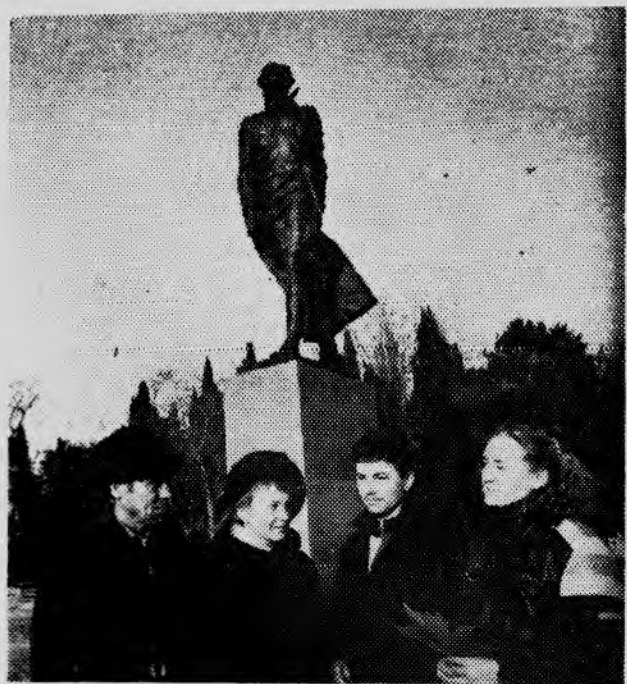
Недавно наши горняки побывали по туристическим путевкам «Сочи — Теберда» у памятника Н. Островскому.