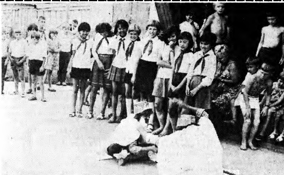
ВМЕСТЕ — ДРУЖНАЯ СЕМЬЯ.