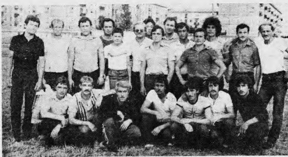
Самым массовым в общешахтной спартакиаде стал футбол — привилегия молодых.