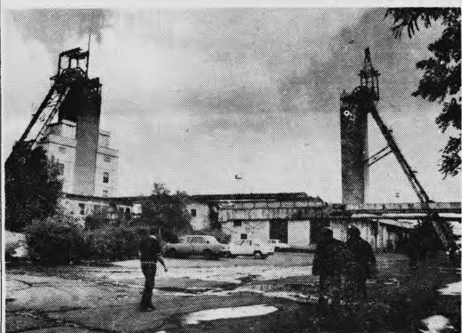
НА РАБОТУ СЛАВНУЮ, НА ДЕЛА ХОРОШИЕ...