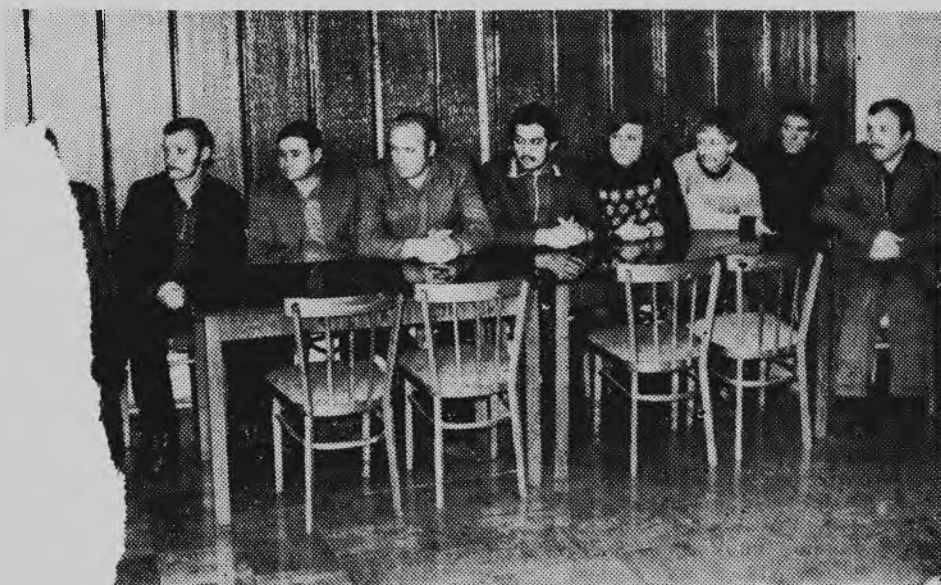
«Зал, «аквариум», «стеклянный» зал — так комнату, где проходят совещания руководителей участков, советы бригадиров.

Здесь же отмечают те коллективы, кто первым перешагивает намеченный рубеж.