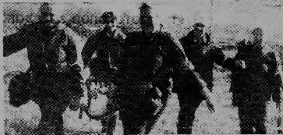
Сандружиницы шахты на учениях.