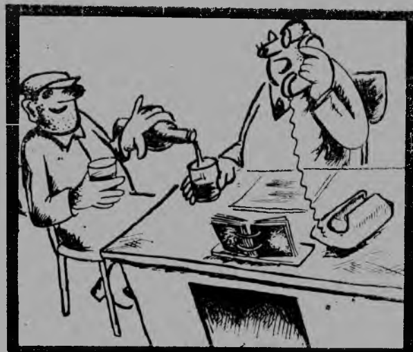
— Говоря откровенно, перевоспитанию Иванов поддается с трудом. Рис. В. СПЕЛЬНИКОВА.