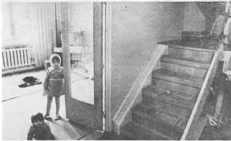
ЗНАКОМИМСЯ С НОВОЙ КВАРТИРОЙ...