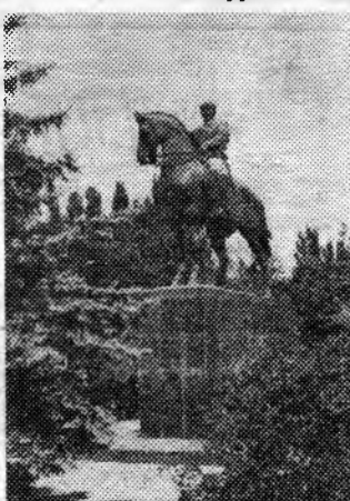
Памятник М. В. Фрунзе.