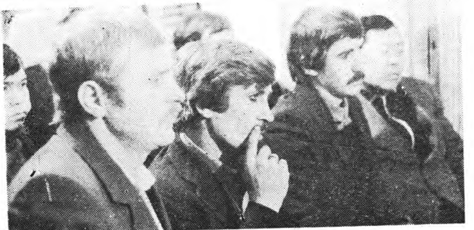
ЕСТЬ О ЧЕМ ПОДУМАТЬ