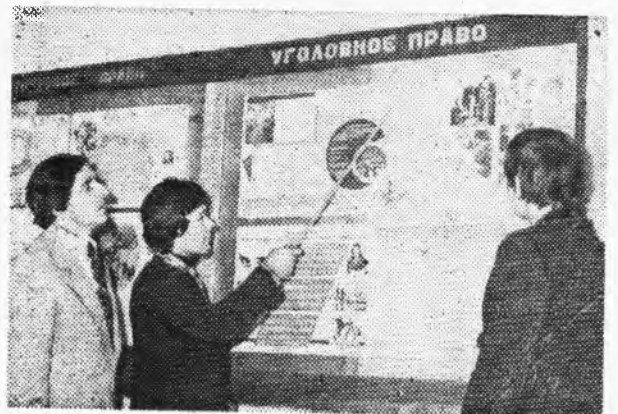
В СПТУ-7 ОВЛАДЕВАЮТ ГОРНЯЦКОЙ ПРОФЕССИЕЙ.

председатель общества «Знание» шахты имени В. И. Ленина.