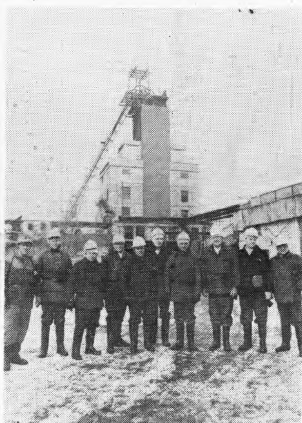
Делегация горняков из Новой Зеландии на шахте имени В. И. Ленина.