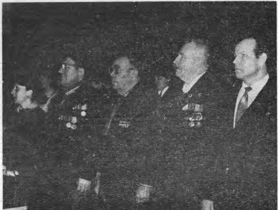
Ветераны Великой Отечественной войны и труда на встрече с пионерами школ города.