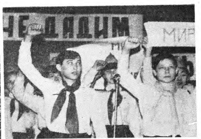
Мы за мир! С нами дети всей планеты!