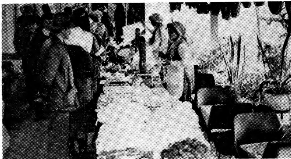
Праздничными выставками отметили работники столовых встречу нового года.