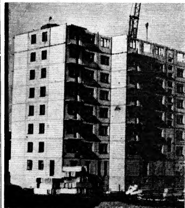
Растет и хорошеет город шахтеров Шахтинск.